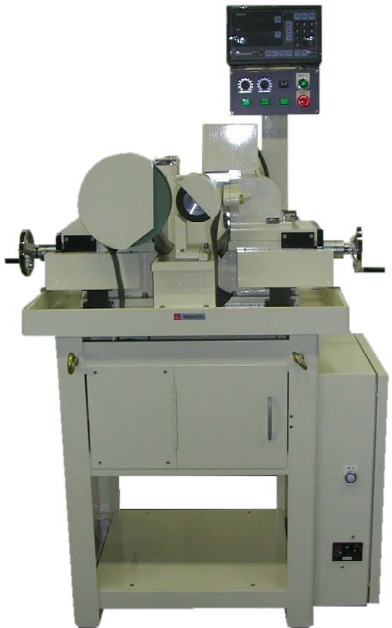
CGBN - 8型