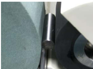
加工用ワークを置いたところ