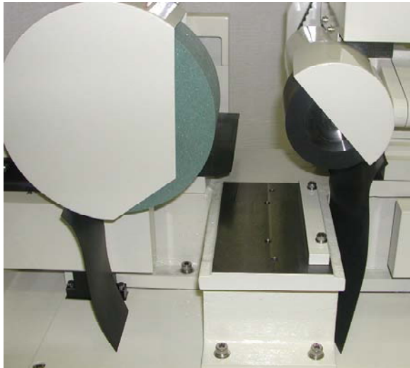
ブレード台を取り外したところ