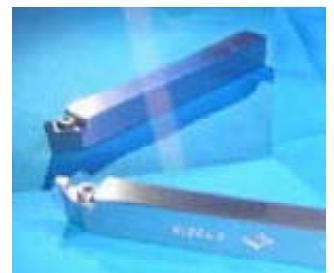
加工したダイヤモンドバイト