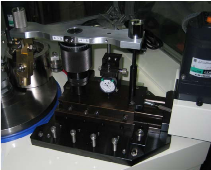
揺動式研磨治具装着例（別売）