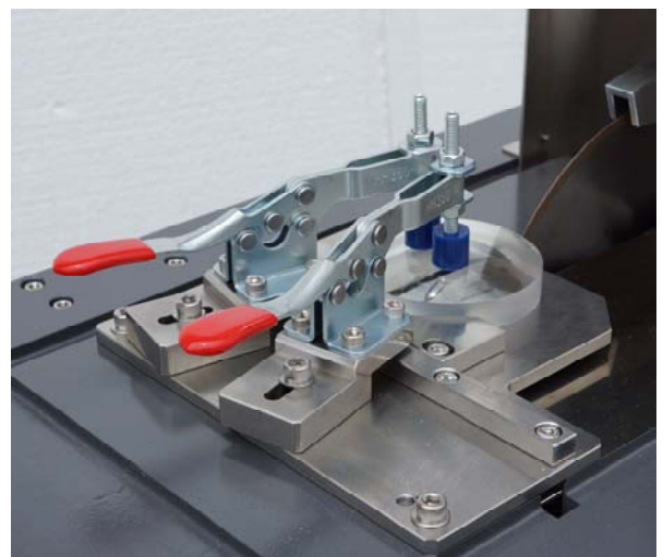
レンズを切断するためにクランプしたところ