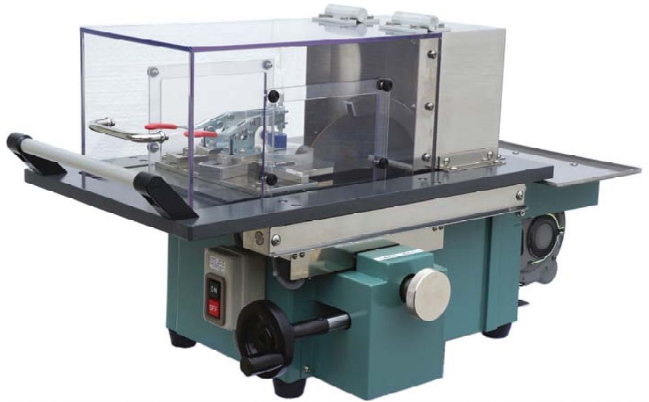
小型卓上切断機 TS-200PS2-TA1型